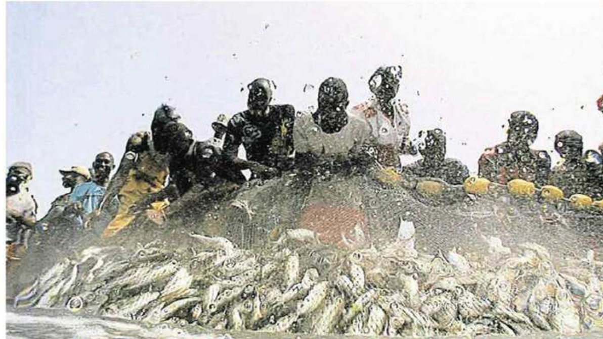
En ouverture du festival, « The end of the line », documentaire choc qui annonce la fin de la pêche...

14 h : Attention hypothermie , du Lorientais Emmanuel Audrain (36 mn, Bretagne). Un film de prévention qui s'appuie sur des témoignages émouvants. Participation du réalisateur. 14 h 45 : Agua Viva , d'Anouk Dominguez (25 mn, Brésil). Une invitation à plonger dans un univers de vie et de mort. 15 h 45 : Territoires , de Marie Daniel (20 mn, France). Les rapports entre les éleveurs de poissons et les comorans dans la Brenne. Participation du réalisateur. 16 h 30 : La barre , de Jean-François Pahun (52 mn, Bretagne). Le drame du 3 octobre 1958 à la barre d'Étel où neuf personnes