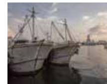
HORS DE PORTÉE