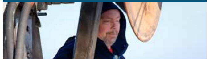
Ouverture du festival: FISH & MEN