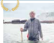
LA SAISON DES TOURTEAUX