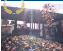
CHAIR ET NACRE