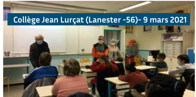
Collège Jean Lurçat (Lanester -56)- 9 mars 2021

Chaque année, le Festival se déplace dans les collèges et lycées à la rencontre des élèves pour projeter un film en sélection puis échanger.