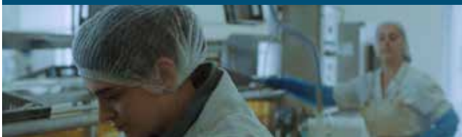
JE SERAI PARMIS LES AMANDIERS (nommé aux Césars 2021)