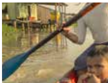
IL ÉTAIT UNE FOIS AU VENEZUELA