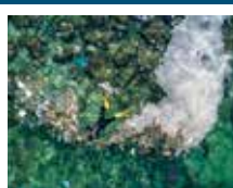
NOTRE MER DE DÉCHETS