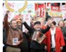
LA TRIBU DES DIEUX