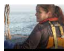
WOMEN IN FISHERIES