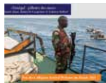
SÉNÉGAL, PILLIERS DE MERS